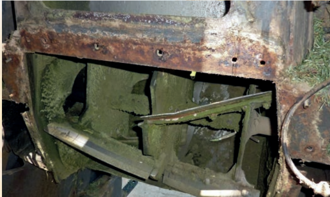
Zerstörte Wurfschaufelwalze am Häcksler

Einige Punkte, die früher häufig zu Unmut im Rahmen der Schadensregulierung geführt haben, sind im neuen Konzept mitversichert :